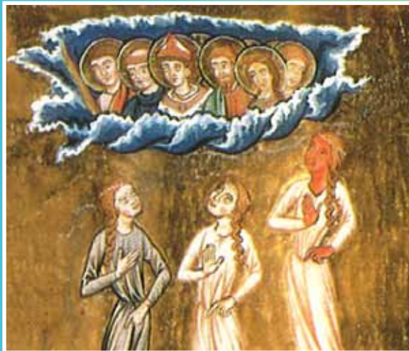
„Das Buch der göttlichen Werke“

Hildegard von Bingen (1098–1179) ist auch heute noch eine hochaktuelle und interessante Frau.