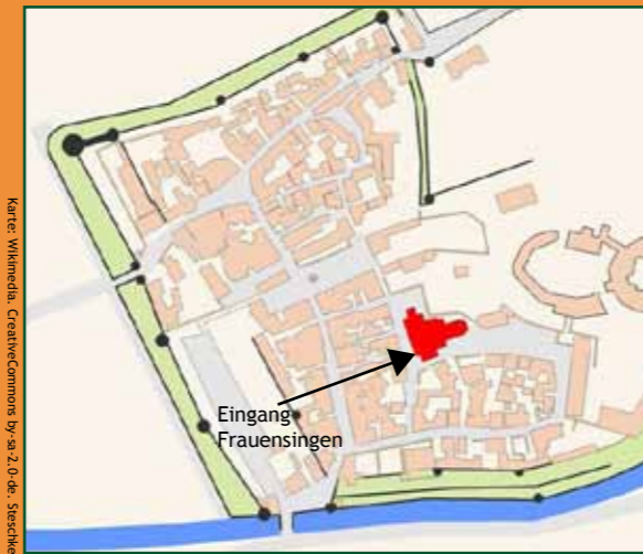
Karte: Wikimedia. CreativeCommons By-SA 2.0 de. Strecke

Für Anreisende mit dem PKW befinden sich ausgeschilderte Parkplätze rund um die Altstadt, meist gebührenfrei, z.B. Parkplatz Mühltorstr., auch für Busse geeignet. Fußweg ca. 5 Minuten www.stadt-buedingen.de/sonstiges/stadtplan-parken